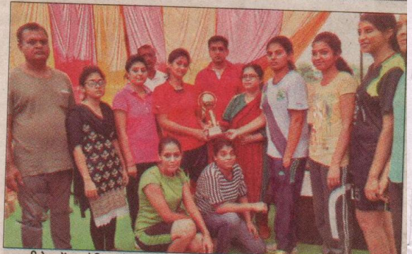
जीजेयू में आयोजित खेल प्रतियोगिताओं के विजेतओं को सम्मानित करते हुए।