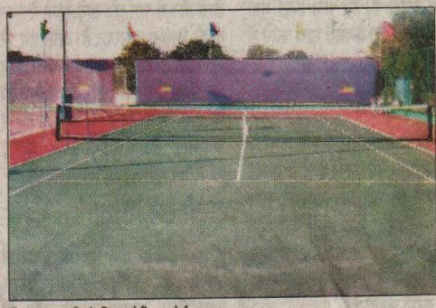
हिसार। गुजवि में स्थित टेनिस कोर्ट।