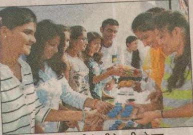
हिसार। मिट्टी के दीये खरीदते हुए

जीजेयू के हिसार के हरियाणा स्कूल ऑफ बिजनेस के एक्टिविटी सेल द्वारा मंगलवार को दीवाली मेला