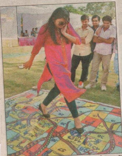
हिसार। जीजेयू में आयोजित दिवाली फेस्टिवल में सांप सीढ़ी खेलते हुए युवती।