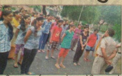
प्रशिक्षण कार्यशाला प्रशिक्षण कार्यशाला को सम्बोधित करते

एड मेकिंग रिकॉर्डिड ऑडियो विज्वल प्रतियोगिता में उत्तम, शुभम,